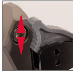
Arto 1 / Arto 2

Facebow readings may be transferred directly onto the articulator Condylars axis pins. Please adjust the Bennet angle to 0° and the Condylar inclination angle to 60°.